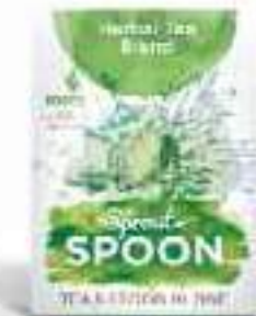
Der Entspannte! Kräutertee