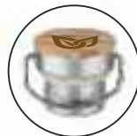
Bambus Edelstahl Verschluss

Für die THERMOclassic & SPORTSclassic stehen 4 Verschlüsse zur Auswahl: