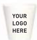
Druck auf Hardcover Pot ab 250 Stück