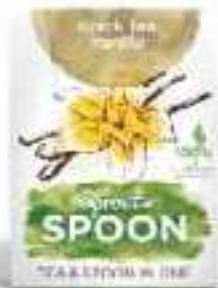
Der Klassiker! Schwarztee Vanille