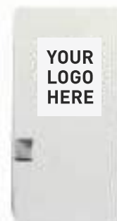
Sticker auf Einzelversandkarton ab 100 Stück