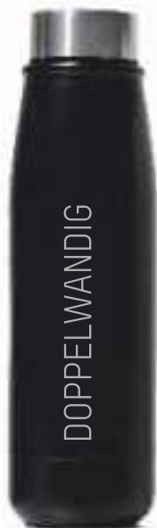
THERMOactive 530 ml / schwarz