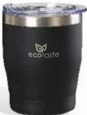
THERMOminicup 300 ml / schwarz