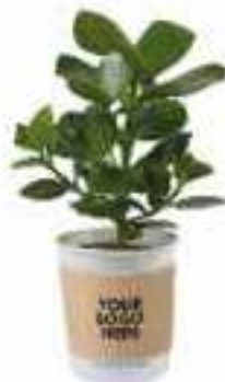
Sleeve ab 250 Stück