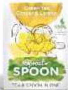
Der Muntermacher! Grüntee Ingwer & Zitrone