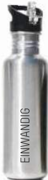
SPORTSclassic 800 ml / silber

Alle Thermo's sind doppelwandig - für Warm- und Kaltgetränke geeignet