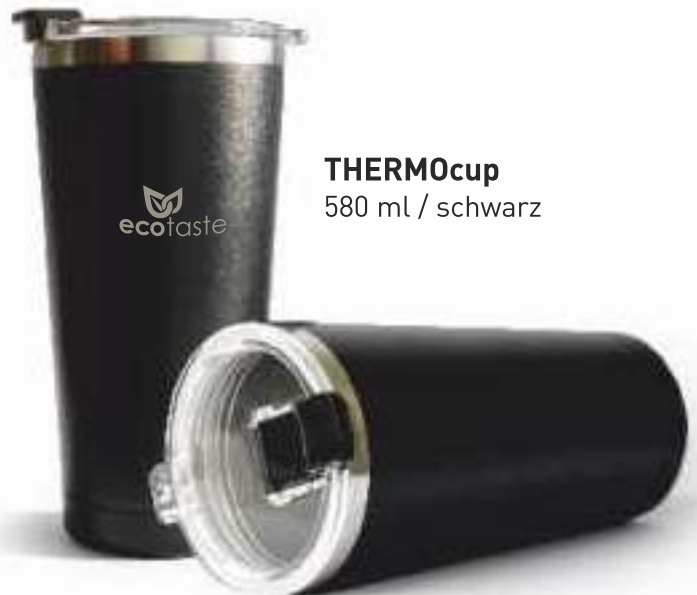
THERMOcup 580 ml / schwarz

Ab 50 Stück mit Druck oder Gravur, Ab 1.000 Stück als Sonderproduktion möglich!