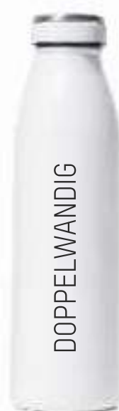
THERMOLifestyle 500 ml / weiß

Mit oder ohne Tragegriff / Trageschlaufe