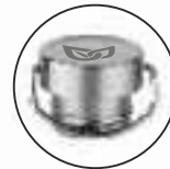
Classic Edelstahl Verschluss