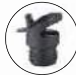
Public Sport Verschluss