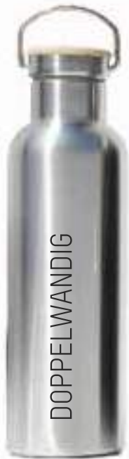
THERMOclassic 800 ml / silber