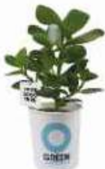
Pflanzenanhänger ab 50 Stück